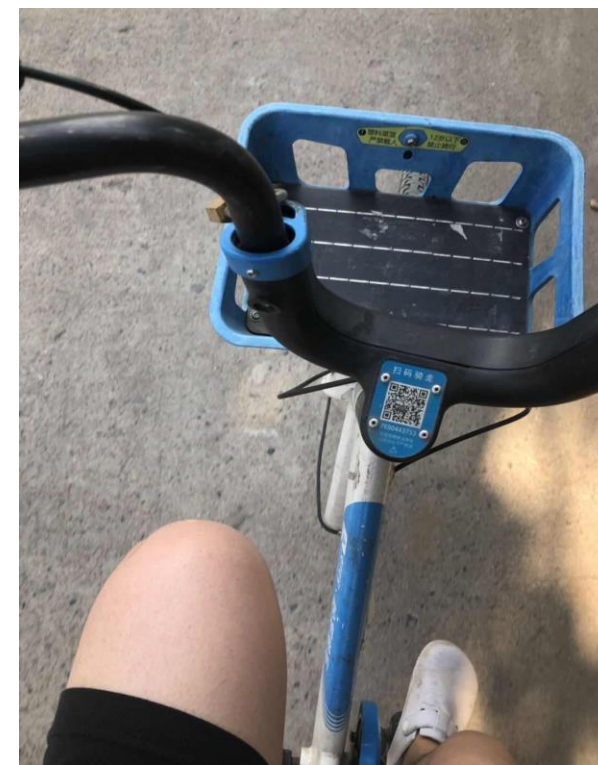
常見單車:支付寶Hello 單車&維信青桔