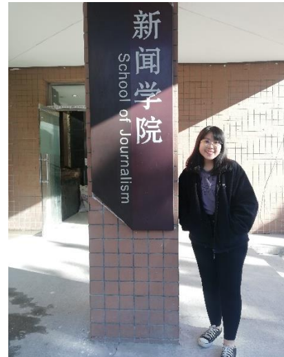
/攝於中國傳媒大學

赴陸交換的這趟旅程，特別感謝靜宜大學提供了這難能可貴的機會，讓我有機會在大學生涯以交換生身份體驗及擴展自身的國際視野。同時，也藉著這份交換的心得，讓自己能够以當事人和局外者的不同角度回顧和記錄這交換旅程所發生、學習與相遇的人事物。