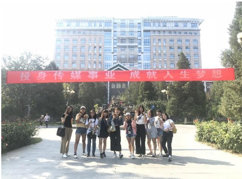
與交換生們的北京一日遊

最後，感謝靜宜大學，國際處老師還有家人給我機會參與這趟交換旅程，為我大學生涯中多了一份特別的體驗與回憶。感謝交換夥伴兼室友彼此之間的扶持與關心。感恩在交換期間遇見的所有人事物，讓我可以從他們身上學習的同時，也看見了不一樣的自己。讓原本較為拘束個性的我慢慢蛻變成有獨立思考且逐漸學會自我表達的自己，這或許是我這趟交換旅程最珍貴的收穫。即使交換回國後，我也會持續增進自己以及勇於嘗試任何的機會，從中發掘自己更多的可能性，並且會把交換期間的所學加以運用在未來的道路。