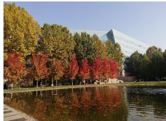
/中國傳媒大學一秋