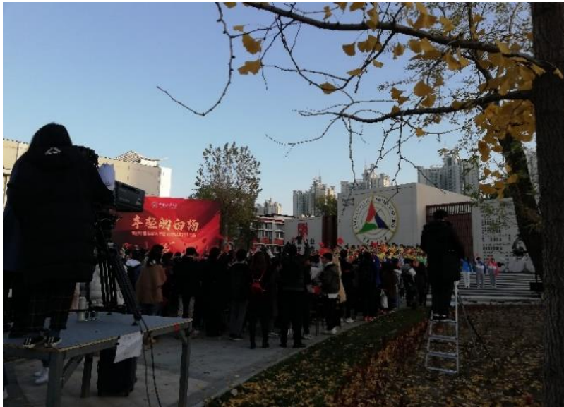
中國傳媒大學 65 週年校慶