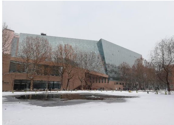
/中國傳媒大學一雪