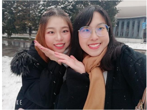
上學期一起交換的夥伴兼室友