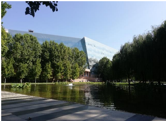
/中國傳媒大學一夏