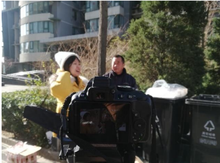
與北京同學到社區進行採訪作業

藉著過往國外求學的經驗，再次到新的環境學習與生活，對比一年前剛到臺灣升學的時候來說，這一次過程雖然沒有學長姐的幫助，但卻又更熟悉及瞭解如何讓自己更快速地適應與處理生活亦或是學習上的難題，同時也擁有神一般的夥伴兼室友還有交換生們的互相照顧與鼓勵。當然，也非常感謝中國傳媒大學的國際處與授課老師都盡可能的幫助交換生們解決住宿、選課與課堂上的問題，讓我們有一個對接的窗口，讓所有的難題都能夠得到解決。因為有大家的幫助，才能讓我們能夠順利完成交換。