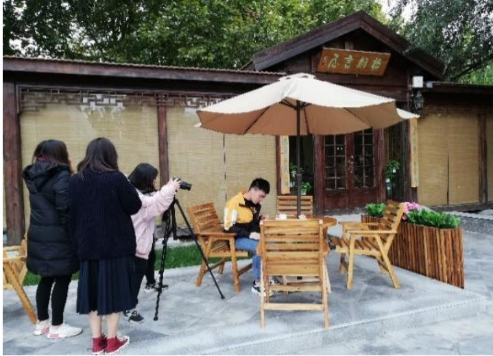
課堂作業影片拍攝