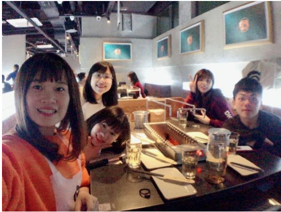
臨別秋波與新聞學院的交換生聚餐